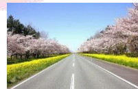
桜並木と菜の花ロード イメージ

県南各地(8:00~8:50 発) == 秋田・千秋公園【自由散策】 == 食彩の宿 北限亭【昼食】 == == 日本国花苑【自由散策】 == 大湯村・桜並木と菜の花ロード【車窓見学】 == == 道の駅おおがた【お買物】 == 県南各地(17:45~18:30 頃着)